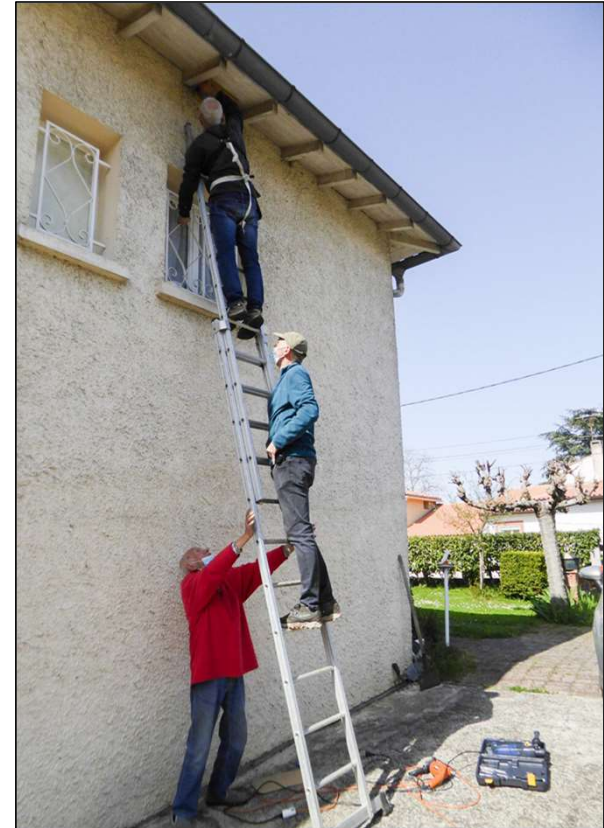
Saint-Orens, mars 2024