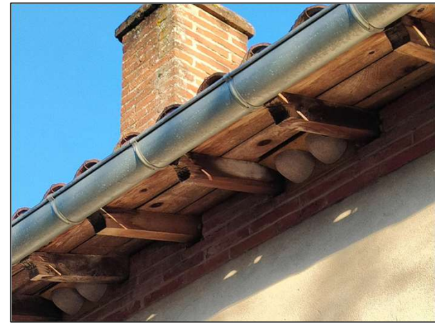
Saint-Orens, mars 2024