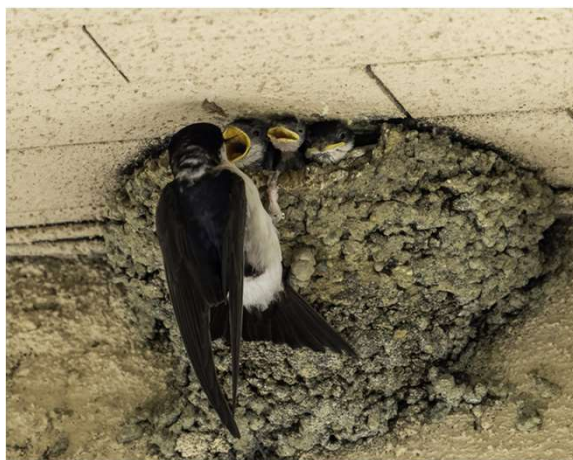
Saint-Orens, mars 2024