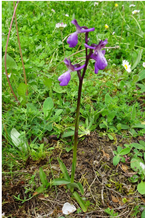
Orchis peint : Anacamptis morio subsp. picta