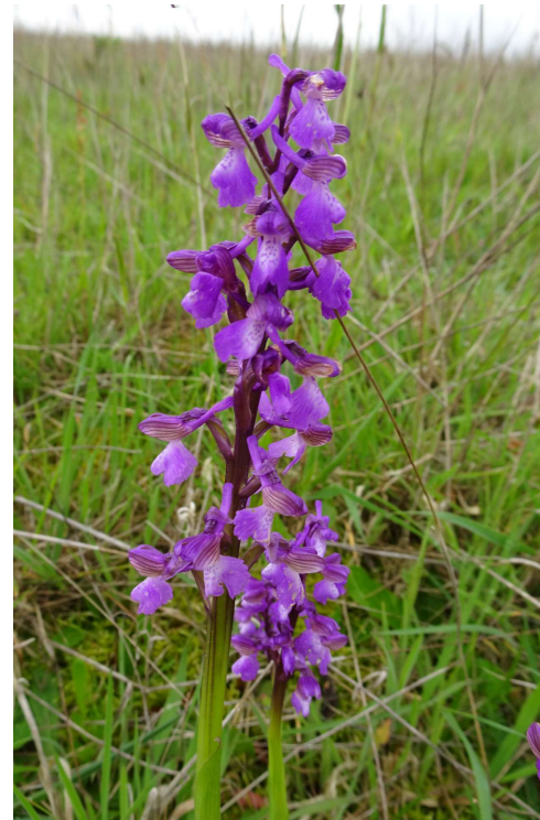
Orchis bouffon : Anacamptis morio subsp. morio