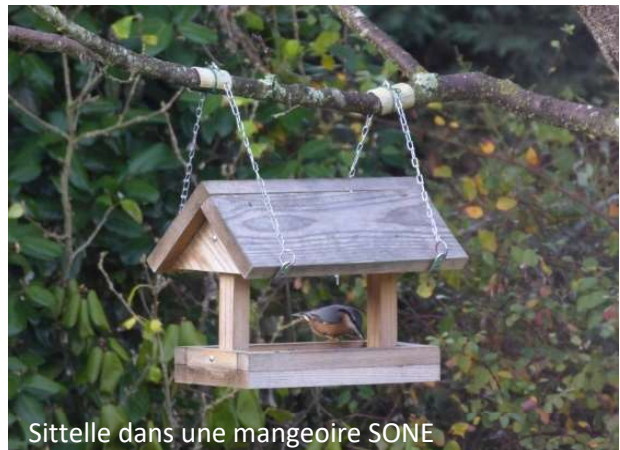
Sittelle dans une mangeoire SONE