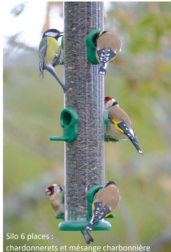
Silo 6 places : chardonnerets et mésange charbonnière

Je les disperse en différents endroits du jardin pour limiter la concentration en oiseaux, qui favorise la propagation de maladies. Elles peuvent être fixées sur un piquet, un mur, ou suspendues à une branche d'arbre ou un support artificiel. Elles doivent être bien dégagées, pour que les oiseaux voient venir les prédateurs, mais à proximité d'un arbre ou buisson, ce qui leur permet d'approcher à couvert et de s'abriter rapidement après s'être nourris. Et, bien sûr, je les positionne de façon à pouvoir observer et photographier les oiseaux depuis mes fenêtres : au cœur de l'hiver, le spectacle est quasi permanent, souvent instructif et parfois cocasse. Mais attention cependant à ne pas les placer trop près des fenêtres ou baies : le risque de collision avec les vitres est alors important et souvent mortel.