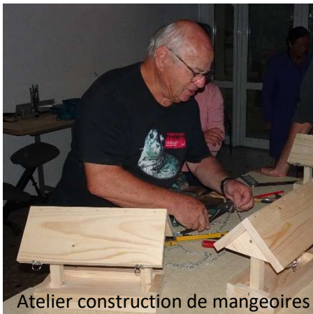
Atelier construction de mangeoires

Oui, cela peut paraître beaucoup, mais, il faut tenir compte des comportements des oiseaux. Certains, comme les pinsons, ne vont qu'aux mangeoires au sol, d'autres comme les mésanges à longue queue utiliseront uniquement les mangeoires suspendues contenant des boules de graisse. Enfin, les mangeoires à plateau attirent de très nombreuses espèces : verdiers, chardonnerets, sittelles, moineaux, mésanges, rouges-gorges, étourneaux, pics épeiches... En les équipant d'un toit assez bas, les graines seront protégées de la pluie ...et des oiseaux voraces comme les tourterelles ou les pies qui peuvent dévaliser la mangeoire dès le matin ! Ce sont ce type de mangeoires que les adhérents de SONE peuvent construire lors d'ateliers menuiserie organisés par Jean-Marie Kessler.