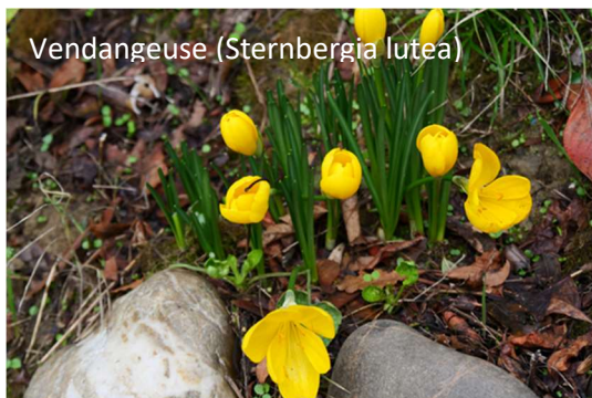
Vendangeuse ( Sternbergia lutea )

Dans les années 1980, la municipalité de Portet sur Garonne devient propriétaire d'un ancien site d'extraction de sable et graviers situé en rive droite de l'Ariège puis de la Garonne au niveau de leur confluence, qu'elle réaménage en parc ouvert au public avec une ambiance de « nature sauvage ».