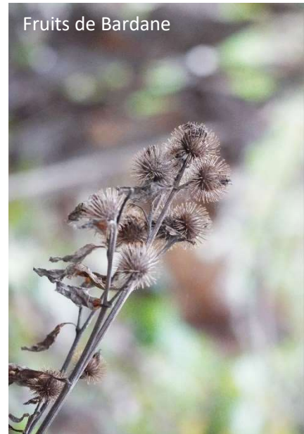
Fruits de Bardane

Nous avons pu ensuite voir plusieurs plantes exotiques envahissantes. Des infestations de Renouées asiatiques, étouffant littéralement la végétation en place, ont ainsi pu être observées. Quelques pieds bien vigoureux de raisins d'Amérique ( Phytolacca americana ) ont aussi été vus, certains ayant été récemment coupés par le personnel en charge de la gestion de la Réserve afin d'enrayer son extension, source d'appauvrissement de la biodiversité.