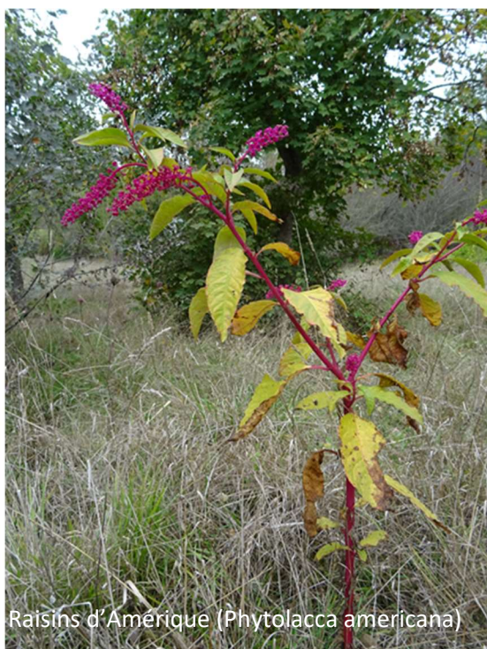
Raisins d'Amérique ( Phytolacca americana )