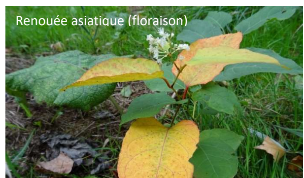
Renouée asiatique (floraison)