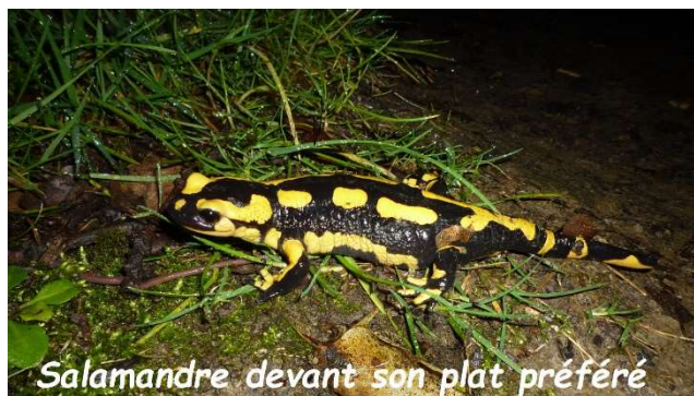
Salamandre devant son plat préféré